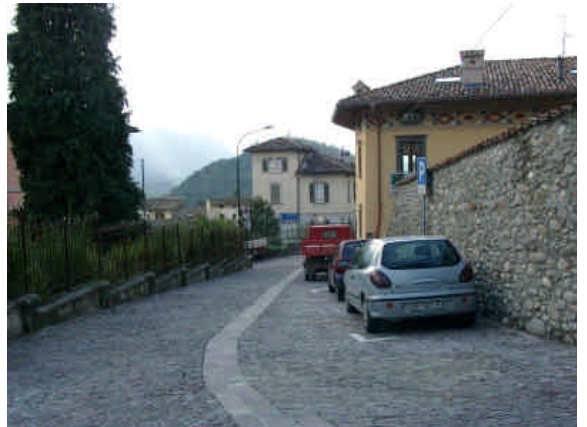
Scendendo lungo Via Fogaccia si incontrano esempi di delimitazione delle proprietà sia in forma di muro cieco (Casa Savoldelli) che in forma di recinzione metallica permeabile alla vista.

Ai margini del centro storico l'edificazione assume spesso carattere di villa/palazzo isolato e circondato da giardini. I confini delle proprietà sono definiti spesso da recinzioni metalliche permeabili alla vista come nell'esempio di Via Fogaccia / angolo Via Giovanni XXIII°.