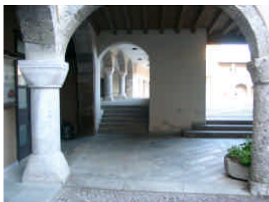
I PORTICI DI PIAZZA SANT'ANNA