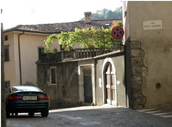
VIA FANZAGO 30