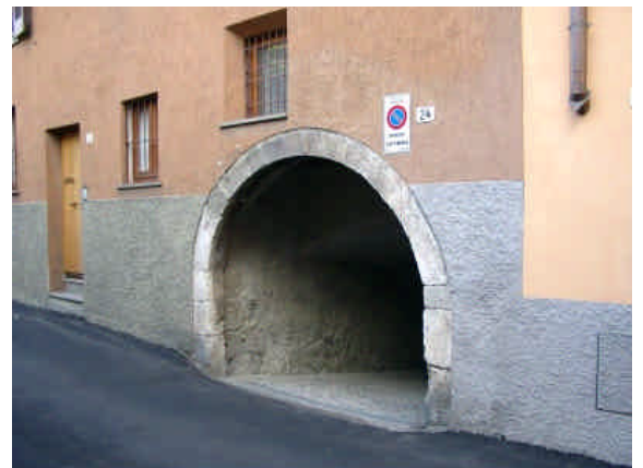
N° CIVICO 24