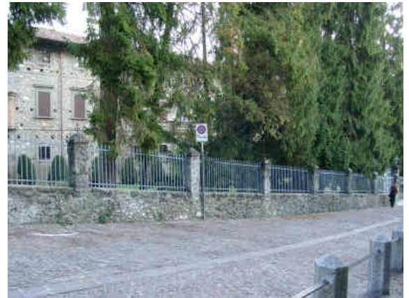
Attraverso la recinzione permeabile alla vista il giardino di Palazzo Fogaccia mostra ai passanti una parte di sé.