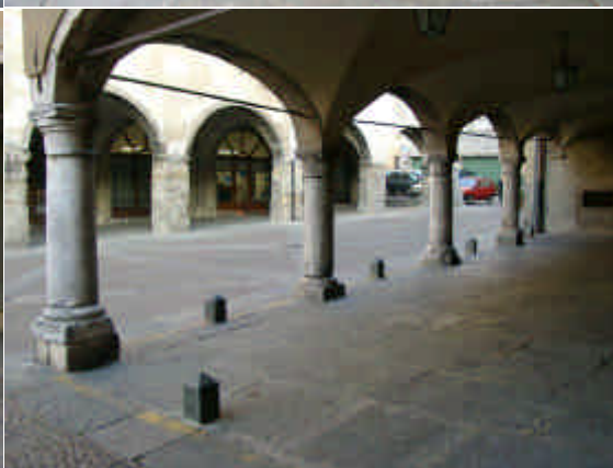
I PORTICI DI PIAZZA OROLOGIO