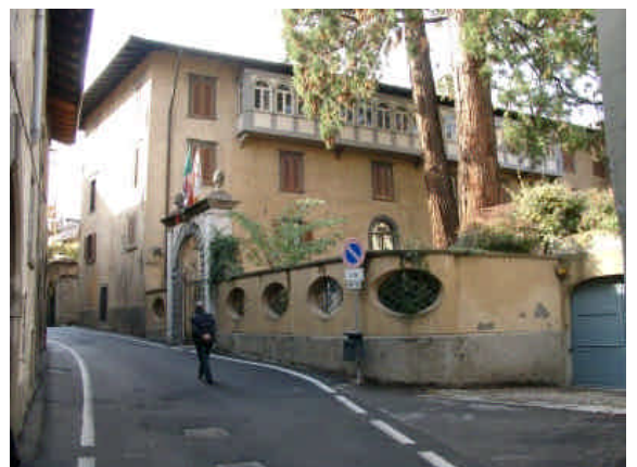
Palazzo Marinoni-Barca Il muro di confine, pur conservando la propria massa, si "alleggerisce" con le aperture ovali attraverso le quali il giardino interno entra a far parte della scena urbana.

Via Agazzi / angolo Via Maffei / Via Baldi Il confine di proprietà assume la forma di muretto in pietra con sovrastante barriera metallica come accade nella fascia più esterna di giardini.