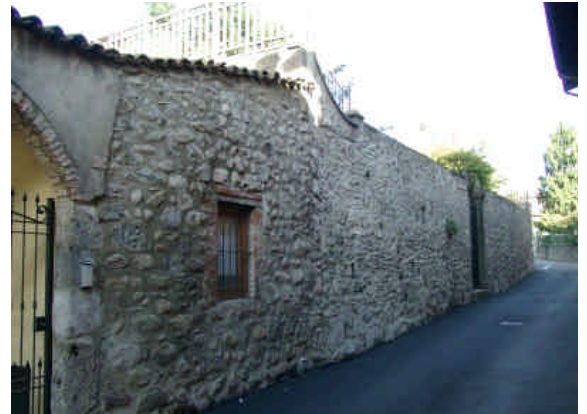
VIA MAFFEI 23