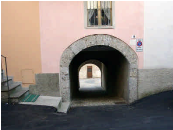
N° CIVICO 18