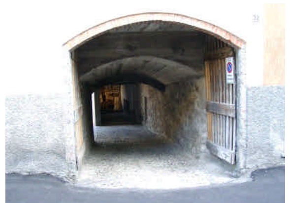
N° CIVICO 32